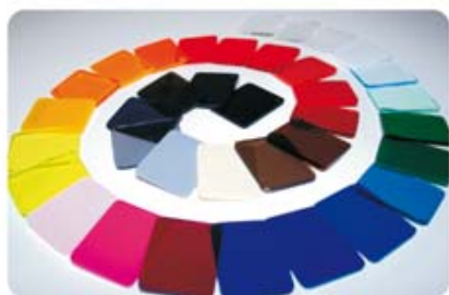
Infinidade de cores

Na edição anterior, na seção Tradição, não citamos o responsável pelo projeto do Olympiapark, em Munique. É o arquiteto alemão Frei Otto que no dia 18 de outubro recebeu em Tóquio o Prêmio Imperiale pelas grandes coberturas tensionadas em acrílico do Olympiapark.