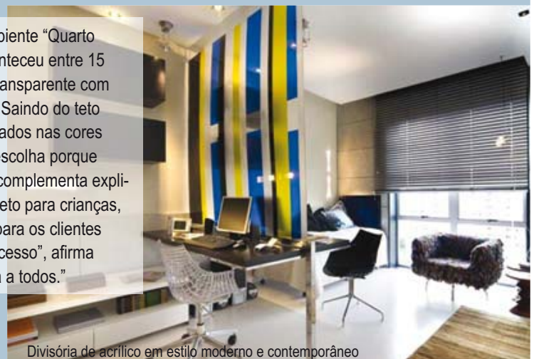
Divisória de acrílico em estilo moderno e contemporâneo